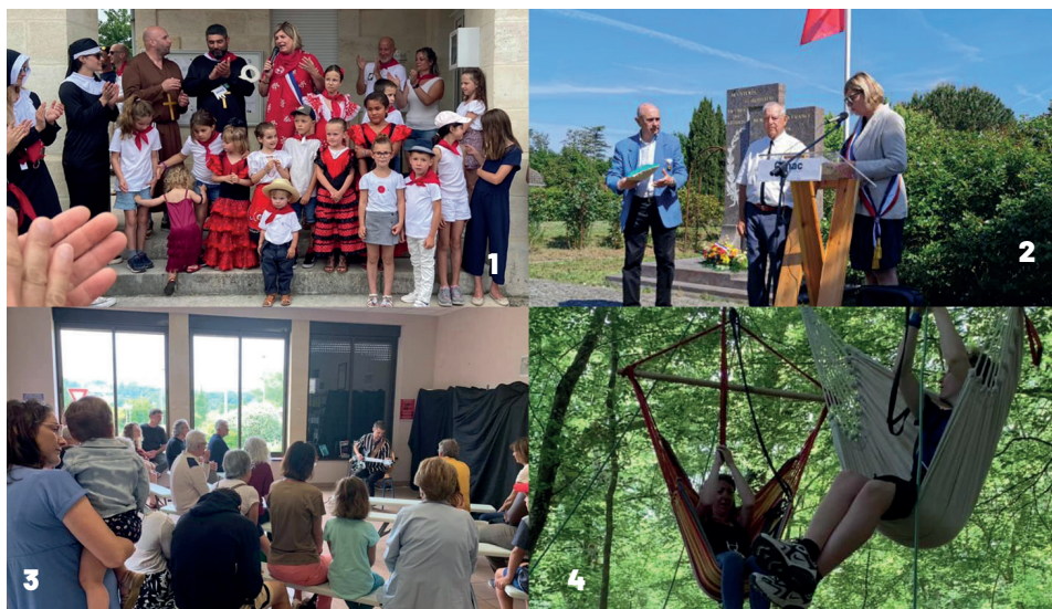
1. San Pimpine - Remise des clés de la ville / 2. Cérémonie du 8 mai / 3. Festival Jazz 360 4. Fête de la Nature