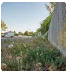
Règlement communal de voirie