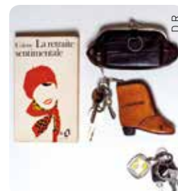
Bibliothèque : A vos marques, prêts, portraits