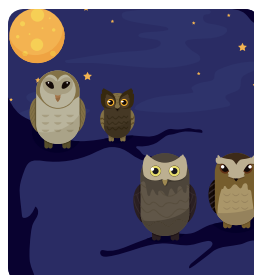
Coupure de l'éclairage la nuit