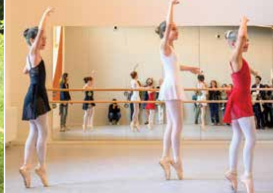
Inauguration Salle Multi-Activités