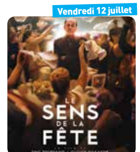
Vendredi 12 juillet Ciné plein air à Cénac