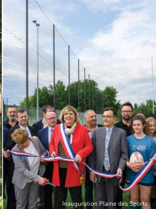
Inauguration Plaine des Sports