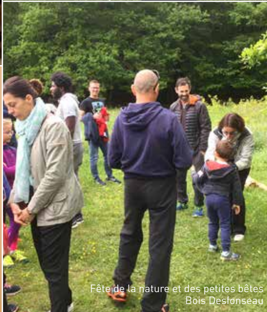
Fête de la nature et des petites bêtes Bois Desfonseau