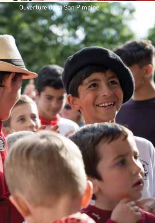
Ouverture de la San Pimpine