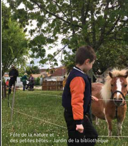
Fête de la nature et des petites bêtes - Jardin de la bibliothèque