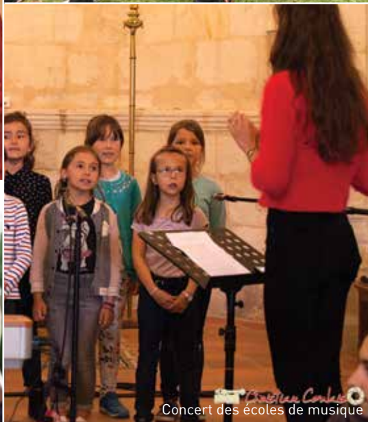
Concert des écoles de musique