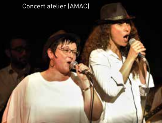
Concert atelier (AMAC)